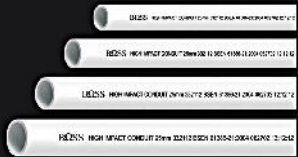
(ภาพ 2.90 ซม.)

ท่อร้อยสายไฟชนิดหนา สำหรับร้อยสายไฟ (สีขาว) BSEN 61386 - 21 : 2004