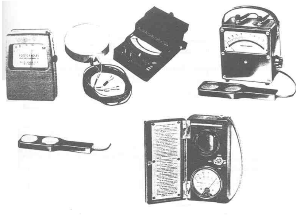
รูปที่ 2.3 เครื่องวัดปริมาณการส่องสว่าง